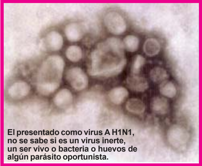
El presentado como virus A H1N1, no se sabe si es un virus inerte, un ser vivo o bacteria o huevos de algún parásito oportunista.

Calculan tal aumento de ventas que el valor de sus acciones se ha disparado y Donald Rumsfeld, ex Secretario de Defensa de los Estados Unidos, amigo de Dick Cheney, ex Vi-